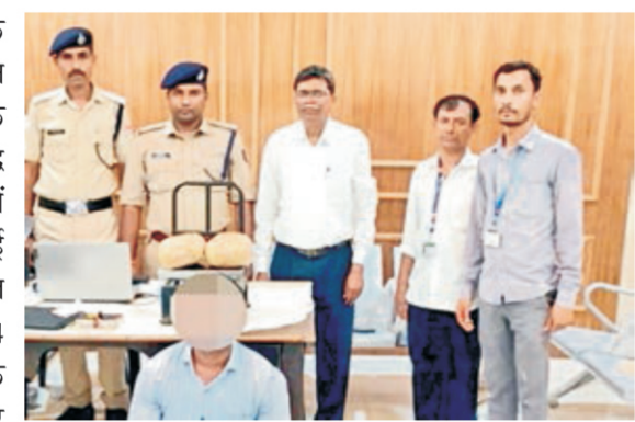
होने पर उसे रोककर पृच्छताछ की गई, जिसमें