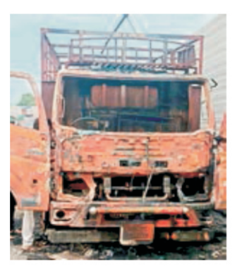
नुकसान हुआ है। जानकारी के अनुसार, छत्तीसगढ़ राज्य के दुर्ग

सड़क अर्जुनी-नागपुर-रायपुर राष्ट्रीय महामार्ग क्र. 53 पर स्थित शशिकरण मंदिर फ्लाईओवर के पास रविवार की रात करीब 2 बजे रायपुर से नागपुर की ओर जा रहे ट्रक में अचानक आग लग गई। हालांकि इस घटना कोई जनहानी नहीं हुई है। लेकिन ट्रक का काफी